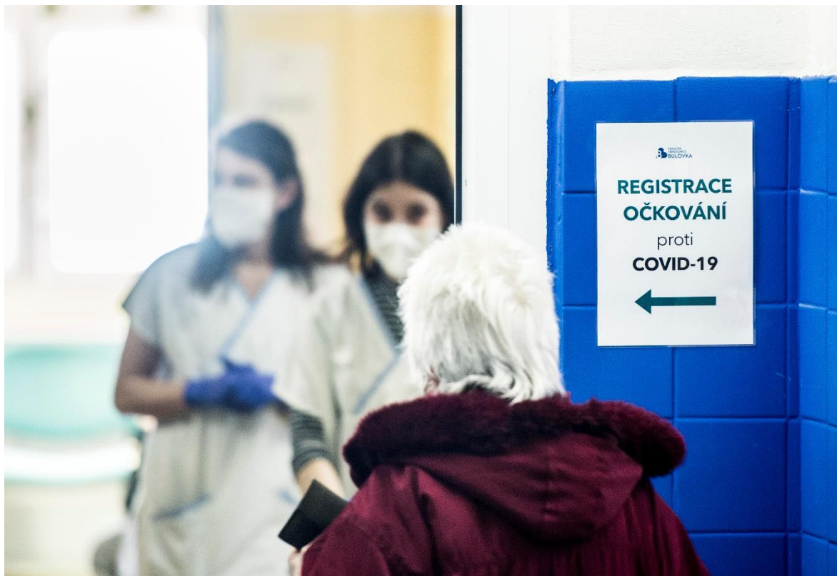
Fakultní nemocnice Bulovka.

Fotografie spoluautorů studie z CERGE-EI a z FSV UK jsou k dispozici zde: https://fotobanka.avcr.cz/search/results?query=bauer