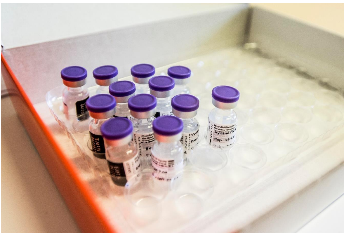
Fakultní nemocnice Bulovka.