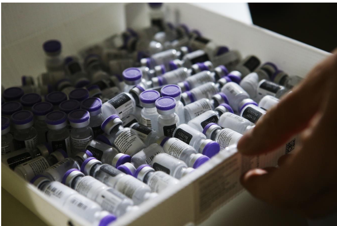
Fakultní nemocnice Královské Vinohrady.